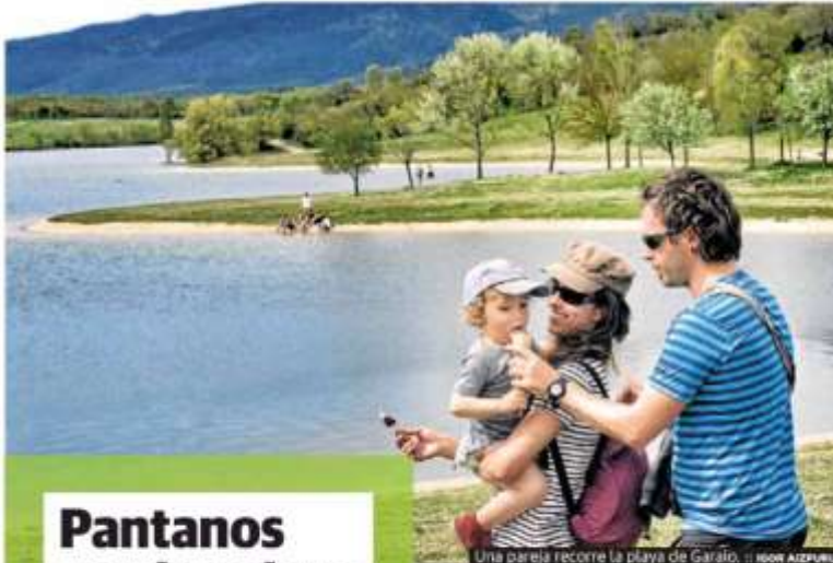
Una pareja recorre la playa de Garatío. ILKOR AIZPURU