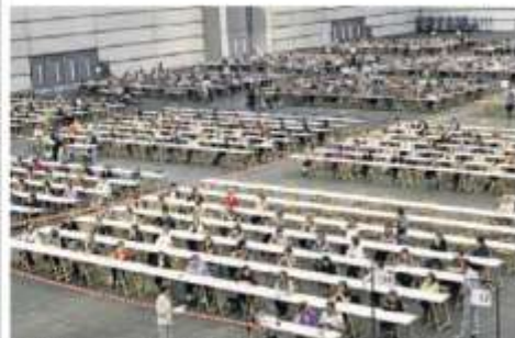
Aspirantes a una plaza en la última OPE de Educación.

La oferta de 577 plazas ha sido criticada en repetidas ocasiones por los sindicatos al ser «totalmente insuficiente». El aumento de las matriculaciones de alumnos en los centros en los últimos años «no ha provocado el incremento de las plantillas en la misma proporción, lo que ha llevado al sistema a un déficit de 1.800 docentes», han denunciado las centrales, que alertan también que de los más de 23.000 profesores que operan en el sector, cerca de 7.000 tienen contrato temporal. El Departamento de Educación ha imposibilitado, subrayan, la jubilación anticipada de los profesores o la reducción de la jornada lectiva a partir de los 58 años, lo que lleva a un incremento de la edad media del personal docente, que se sitúa en el caso del funcionario de carrera por encima de los 50 años.