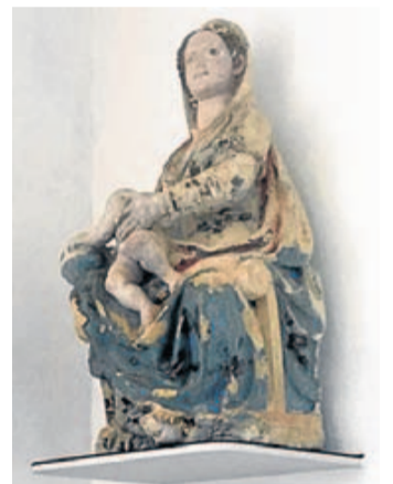
Imagen de Andra Mari. :: D.F.A.

– DHL ocupará durante los próximos cinco años la nave de oficinas con plataforma de acceso directo a pista que perteneció a la compañía Iberia Cargo. La alemana desembolsará en torno a 100.000 euros por ejercicio hasta diciembre de 2022. Aena formalizó ayer la adjudicación del espacio, de 981,78 metros cuadrados de superficie construida, a European Air Transport –la razón social de DHL–, la única que acudió a la puja. La instalación se encuentra muy cerca del recinto que ocupa (y ha ampliado) la empresa de paquetería.